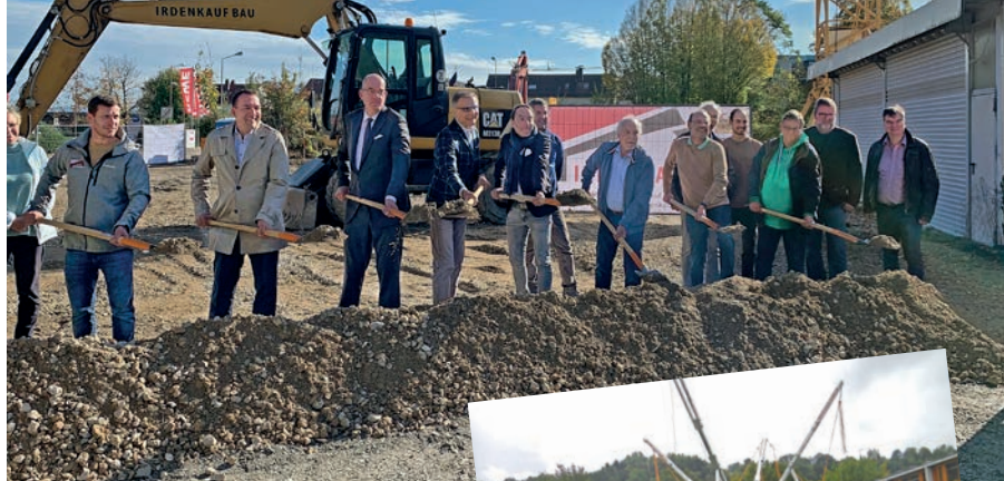
Spatenstich für das Dienstleistungszentrum