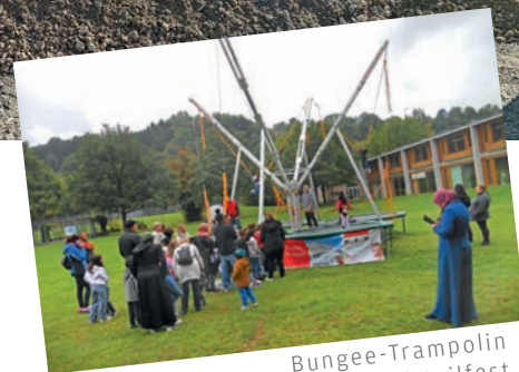
Bungee-Trampolin beim Stadtteilstfest