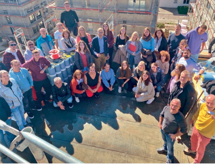
Teilnehmer der „Gmünder Stadtrundfahrt“