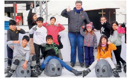
DIE EISBAHN KOMMT WIEDER Mit der VGW sparen! Seite 3