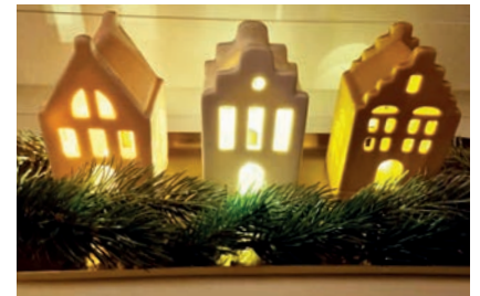
ALLE JAHRE WIEDER... Auf der Suche nach Weihnachten Seite 6