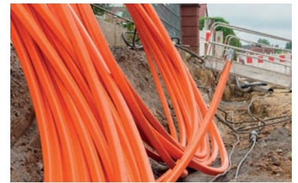
FAIRFAST Das schnelle Internet kommt Seite 4