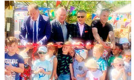
KITA STERNSCHNUPPE Wurde frisch saniert Seite 3

DIE VGW ERRICHTET ZUSAMMEN MIT FAIRFAST EIN EIGENES GLASFASER- NETZ FÜR SIE!