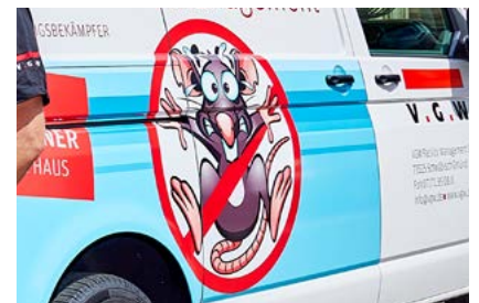
SCHÄDLINGSBEKÄMPFUNG Das neue Team bei der VGW Seite 7