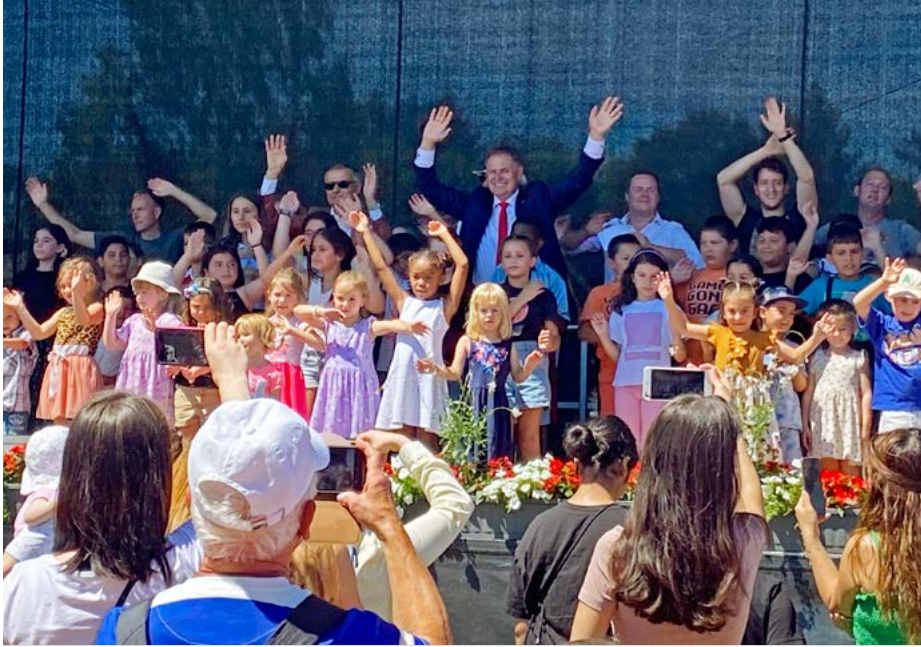
Am Hardtfest hatten alle viel Spaß