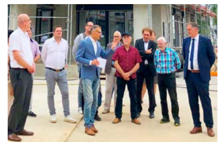
RICHTFEST Am Sonnenhügel Seite 6

Die Pandemie hat eines ganz deutlich gemacht: Eine gute Internet-Anbindung ist für viele Menschen unabdingbar geworden.